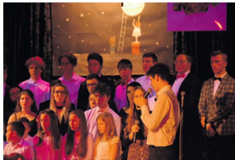
► TEKST: AGNIESZKA NANASZKO ZDJĘCIA: KAMIL BARAŃSKI

Walentynkowy wieczór – 14 lutego spędziliśmy wspólnie z uczniami Liceum Ogólnokształcącego w Lesku, którzy przygotowali z tej okazji przedstawienie pt. „Oblicza Miłości II”.