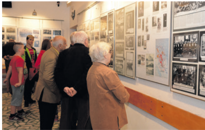
▲ Wystawy w „Małej Galerii” cieszą się dużym zainteresowaniem