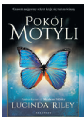
„Pokój motyli” Lucinda Riley

To kronika życia jednego z najwybitniejszych pisarzy XX stulecia – Michaiła Bułhakowa. Swoiste świadectwo czasu, w którym żył i system, z którym przyszło mu się zmagać. Książka zawiera dziennik samego pisarza (o wymownym tytule Pod butem), listy do przyjaciół i nieprzyjaciół oraz dziennik jego trzeciej żony Jeleny (pierwovzór Małgorzaty). Prawie 700 stron objętości, ale warto się z nimi zmierzyć.