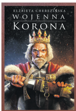
„Wojenna korona” Elżbieta Cherezińska

W czwartym tomie cyklu „Odrodzone Królestwo” koronowany Władysław Łokietek staje przed licznymi problemami, które namnożył okres rozbięcia dzielnicowego. Wielka polityka przeplata się więc z intrygami dworskimi, turniejami rycerskimi i rozgrywkami w alkowie. Historia nie jest chyba najbardziej lubianym przedmiotem w szkołach. Dzięki Elżbiecie Cherezińskiej postaci historyczne przestają być anonimowe, znane tylko z kart podręczników, a stają się ludźmi z krwi i kości. Autorka po raz kolejny udowadnia, że o historii można opowiadać z prawdziwą pasją! Już nikt nie będzie mógł powiedzieć, że średniowiecze było nudne. Zbeletryzowane przez Elżbietę Cherezińską jest niezwykle barwne!