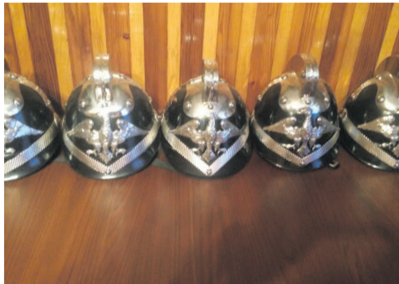
▲ Nowe hełmy dla OSP w Łukawicy

w ramach poddziałania „Wsparcie na wdrażanie operacji w ramach strategii rozwoju lokalnego kierowanego przez społeczność” Programu Rozwoju Obszarów Wiejskich na lata 2014–2020. Łączna wartość projektu to 12890,00 zł.