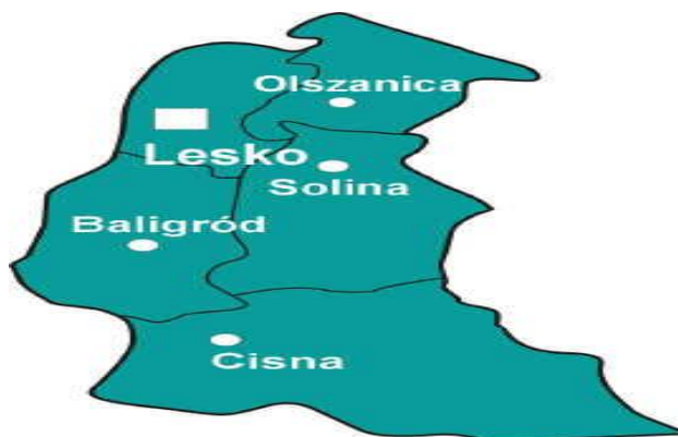
Rysunek 1. Położenie Miasta i Gminy Lesko na terenie powiatu leskiego