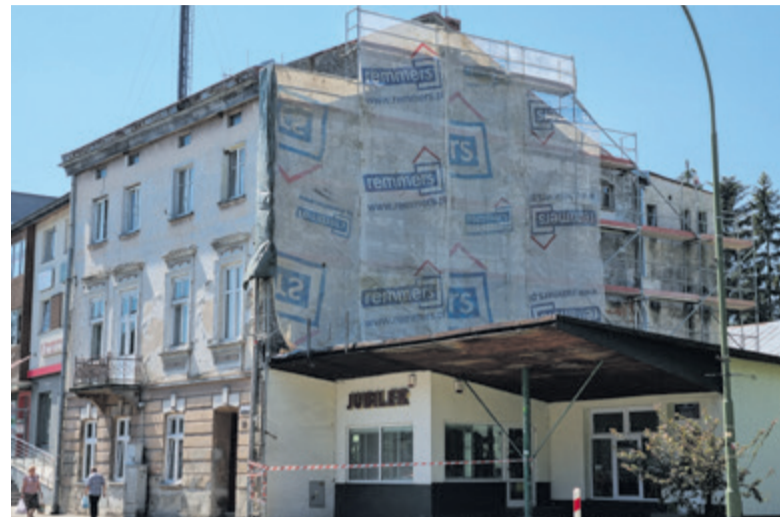
▲ W ramach realizowanych prac w kamienicy przy ul. Rynek 15 wykonany zostanie remont dachu oraz elewacja frontowa i boczna budynku

15, jednak w przetargu kwota przekraczała środki finansowe, które samorząd zamierzał przeznaczyć na to zadanie. W 2022 roku udało się doprowadzić do zawiązania Wspólnoty Mieszkaniowej Rynek 15, która w kwietniu dokonała wyboru zarządu wspólnoty oraz zarządcy. 1 czerwca Wspólnota przyjęła plan gospodarczy na 2022 rok oraz dokonała wyboru oferty na remont budynku. W ramach realizowanych prac wykonany zostanie remont dachu oraz elewacja frontowa i boczna budynku. Całkowity koszt realizacji prac wyniesie 240 000 zł brutto, w tym udział Gminy Lesko wynosi 70 proc. Po wykonaniu zadania, na bocznej