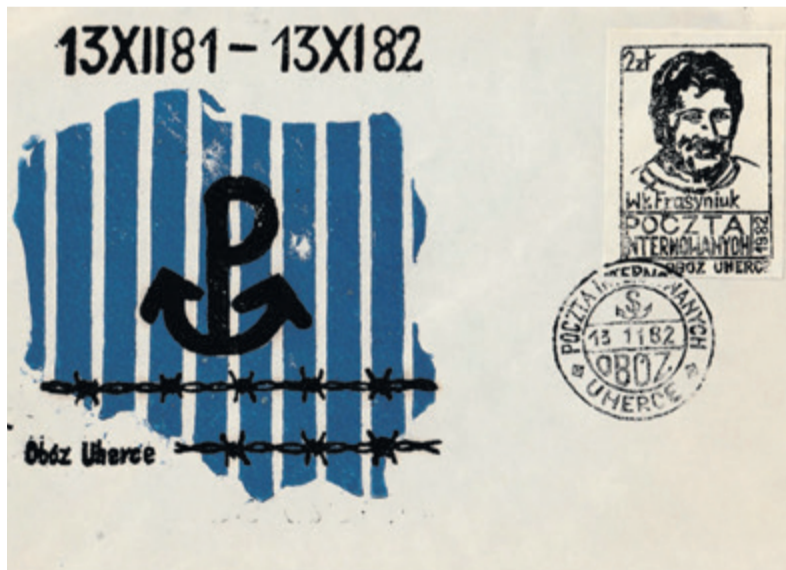
▲ Ostatnia rocznicowa kopertówka z 13 listopada 1982 roku z okolicznościowym stemplem dziennym. Były to ostatnie obchody miesięcznicy w ośrodku, ponieważ 13 grudnia 1982 roku przebywało w nim fizycznie jedynie 12 internowanych.

W Ośrodku Odosobnienia uroczyste obchodzono comiesięczne rocznice wprowadzenia stanu wojennego, tzw. „miesięcznice”.