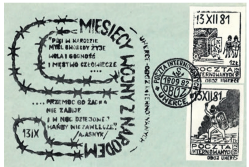
▲ Kopertówka z 13 września 1982 r. „9 miesięcy wojny z narodem”. Autor – projekt i wykonanie internowany Edward Wryszcz