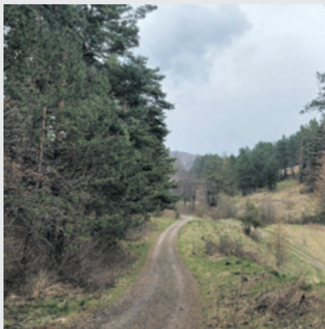
▲ Lescy radni zaproponowali, by obwodnica szła przez teren, który sami wcześniej wpisali w Strategię Rozwoju Gminy

Utrzymanie przebiegu obwodnicy południowej w jej dotychczasowym kształcie, jest jedynym