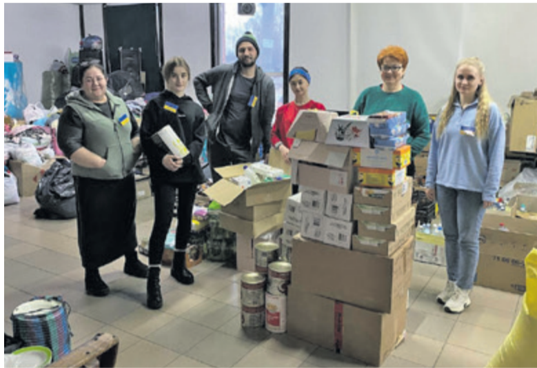
▲ Wolontariusze w magazynie w Kijowie z darami przesyłanymi z Gminy Lesko

Ponad 100 osób – w tym pracownicy urzędu i jednostek organizacyjnych, jak również mieszkańcy Leska, gminnych miejscowości i goście z zagranicy – od 25 lutego z wielkim zaangażowaniem pomagało w punkcie pomocy humanitarnej stworzonym w Urzędzie Miasta i Gminy Lesko. Niektóre osoby były codziennie, inne raz na jakiś czas, ale każda z nich wniosła wielkie serce, ciepło i ofiarną, bezinteresowną pomoc dla potrzebujących.