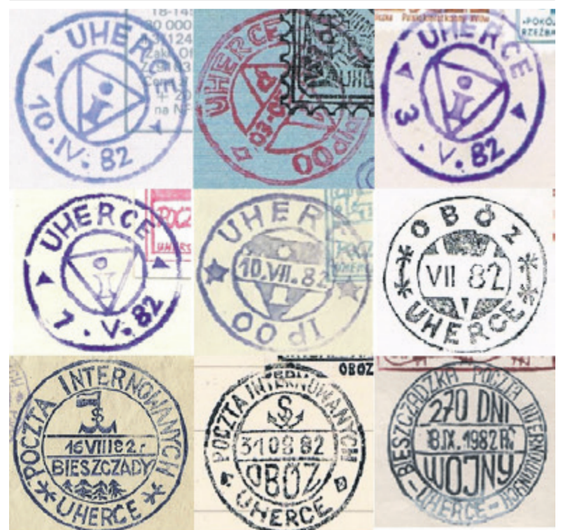
▲ Wybrane przykłady stempli dziennych - datowników przybijanych na znaczkach „kopertówek”