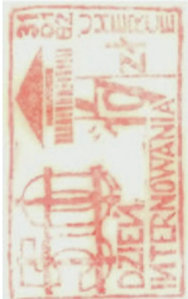
▲ Pierwsza pieczętka wykonana przez Leszka Karcza