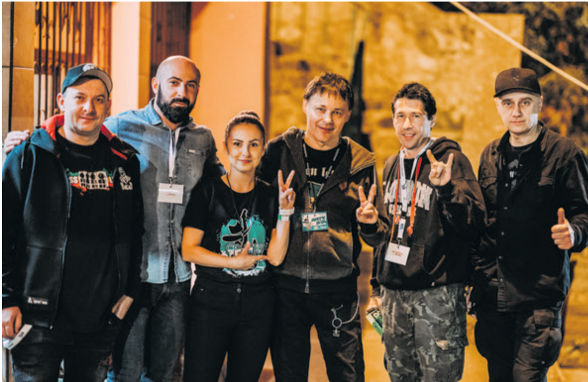
▲ W ubiegłym roku BDK rozpoczął nową formułę Festiwalu a na scenie zaprezentował się m.in. zespół Farben Lehre

niższe. Mamy ulgowe bilety dla mieszkańców i osób spoza gminy Lesko, które można nabyć w przedsprzedaży do 30 czerwca w Bieszczadzkiej Galerii Sztuki Synagoga. Dla mieszkańców Gminy Lesko karnet dwudniowy kosztuje 60 zł, a jednodniowy 40 zł. Bilety dla turystów dostępne są online na stronie eBilet.pl, w cenie: karnet dwudniowy 120 zł, a jednodniowy 70 zł. Poza tym nasi patroni medialni ogłaszają konkursy, w których można wygrać darmowe wejściówki na koncerty, zachęcam do śledzenia naszych mediów społecznościowych. Również nasze Echo Bieszczadów ogłosiło konkurs, w którym są do wygrania 3 dwudniowe wejściówki. Myślę, że dodatkowym atutem dla mieszkańców naszej gminy jest też to, że tak duża impreza organizowana jest na miejscu, odpadają więc koszty transportu czy noclegu.