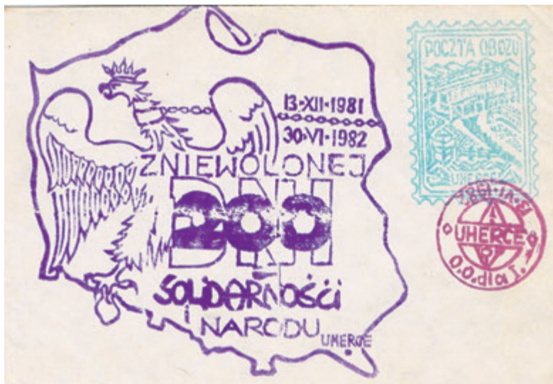
▲ Kopertówka „200 dni zniewolonej Solidarności i Narodu”