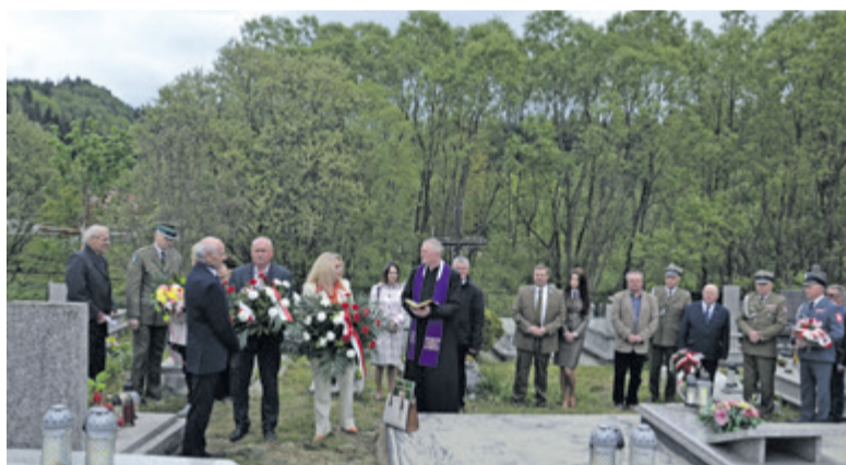
▲ Na cmentarzu w Cisnej, delegacje oddały hołd, złożyły kwiaty na grobach i zapaliły znicze