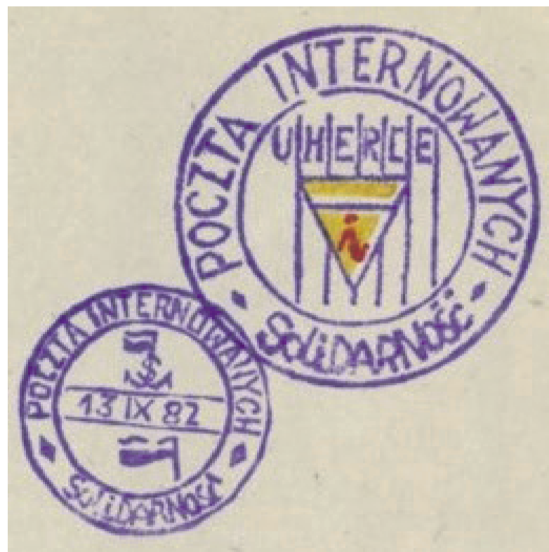
▲ Datownik „13 IX 82”

W nocy z 12 na 13 kwietnia internowani wyszli na spacer, odśpiewali hymn narodowy, „Rotę”, „Boże, coś Polskę” i „Solidarnych”. Wznoszono okrzyki: „Uwolnić Lecha”, „Solidarność”, „NZS”. Funkcjonariusze pełniący służbę w pawilonie nie