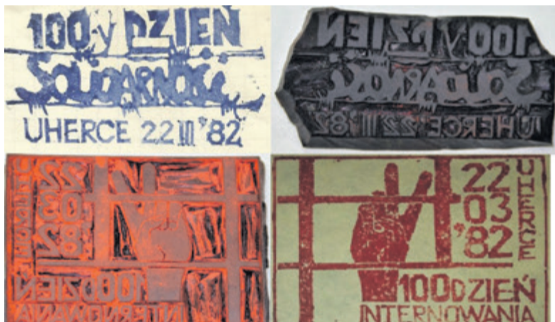
▲ Kolejny przykład upamiętnienia rocznicy 100 dni internowania. Pieczętka wykonał również Leszek Karcz