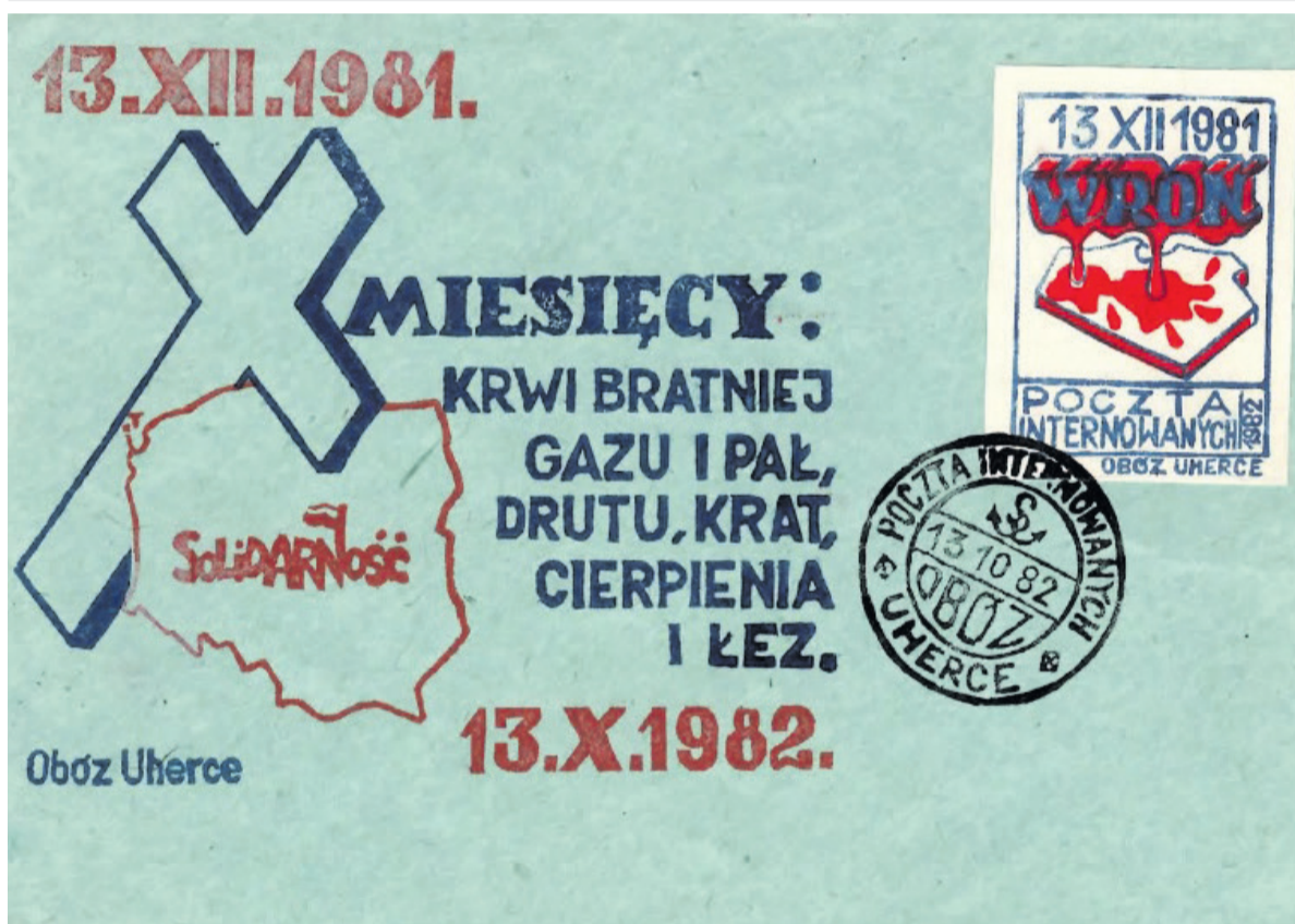
▲ Kopertówka „10 miesięcy krwi bratniej, gazu i pał, drutu, krat, cierpienia i łez” z dnia 13 października 1982 r. wraz z datownikiem – stemplem dziennym.