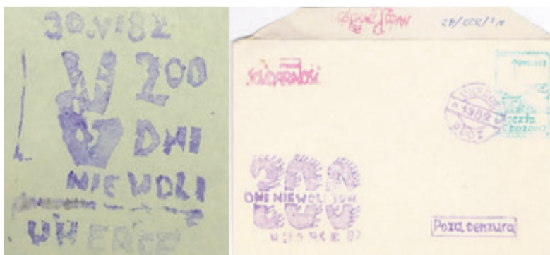
▲ Stempel i kopertówka „200 dni niewoli”. Kopertówki najczęściej wydawane były w limitowanych seriach a numerację odnotowywano na odwrocie koperty. W tym przypadku jest to kopertówka nr 322/82