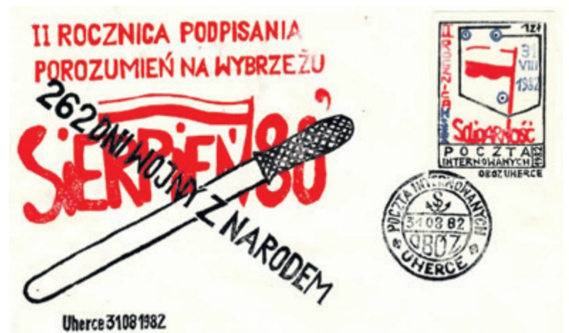
▲ Kopertówka „262 dni wojny z narodem” z dnia 31 sierpnia 1982 r. wydana na okoliczność II Rocznicę Podpisania Porozumień Gdańskich. Do tej daty nawiązuje również okrągły stempel dzienny. Większość kopertówek występowała w odmianach różniących się umieszczanymi na nich znaczkami i datownikami