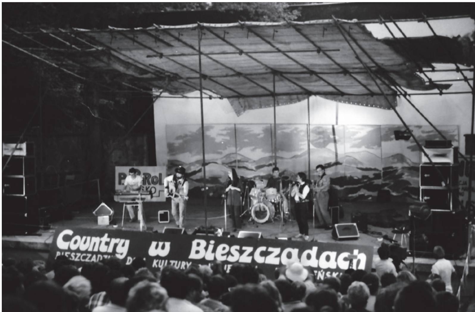
▲ BDK początkiem lat 90. zaczął organizować cykliczne wydarzenie zwane wówczas „Piknikiem Country”

Festiwal jest jak najbardziej kontynuacją, ponieważ historia i tradycja tego wydarzenia jest już na stałe wpisana w nasz region. Nowa formuła jest wyjściem naprzeciw oczekiwaniom uczestników tej imprezy, którzy wielokrotnie mówili, o tym że widzieliby na naszym festiwalu również muzykę rockową. Ponadto chcemy iść z duchem czasu, obecnie rynek festiwalowy mocno się rozwija i ludzie mają do wyboru w całej Polsce naprawdę ogromną liczbę przeróżnych festiwali, które również łączą różne gatunki muzyczne, po to, by dotrzeć do większej liczby odbiorców. Wiemy, że muzyka country i rock są można powiedzieć na dwóch różnych biegunach, ale przyświeca nam idea, że w czasach, w których tak często się różnimy w wielu kwestiach, to właśnie muzyka może nas połączyć i w zeszłym roku to się udało bardzo dobrze. Co najciekawsze również sami wykonawcy