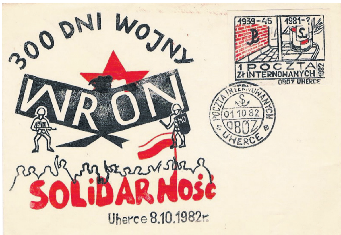
▲ Kopertówka „300 dni wojny” z dnia 8 października 1982 r.