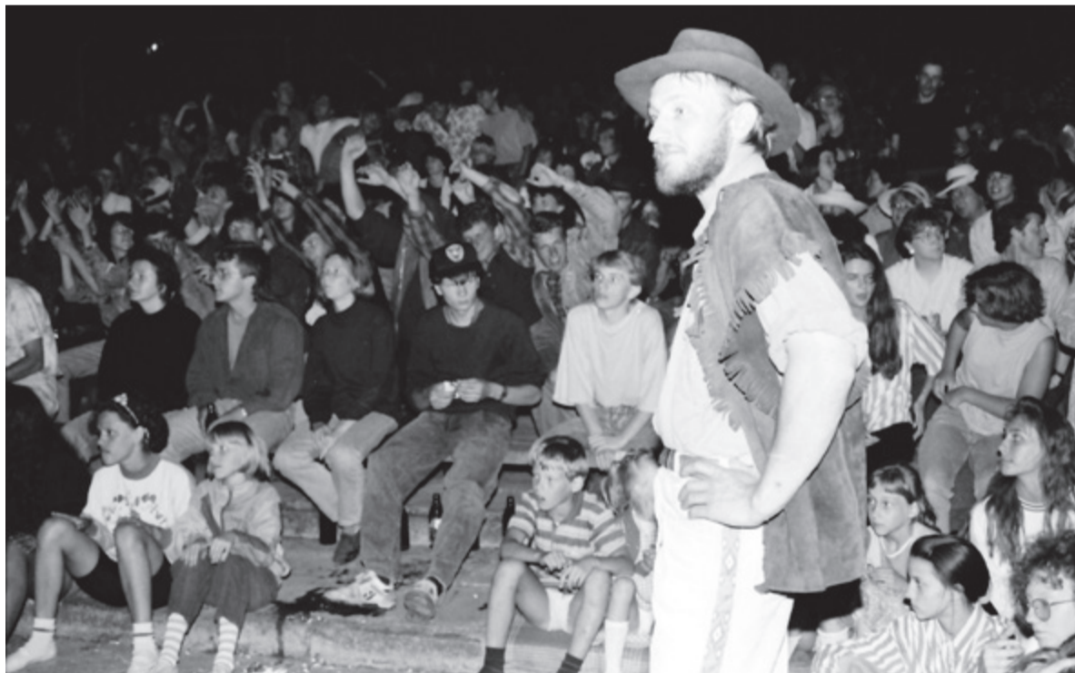
▲ Historia festiwalu sięga końcówki lat 80., kiedy do Leska dotarły kasety magnetofonowe z USA właśnie z muzyką country

nie mają tu żadnych obiekcji, a zdarza się, że prywatnie są fanami zespołów, które występują na scenie.