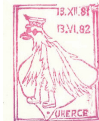
▲ Okolicznościowa pieczęć na półroczcie wprowadzenia stanu wojennego

13 listopada w kolejną miesięcznicę wprowadzenia stanu wojennego o godzinie 12.00 zorganizowano apel na dużym placu spacerowym z biało-czerwoną flagą przepasaną kirem. Odśpiewano kilka pieśni patriotycznych.