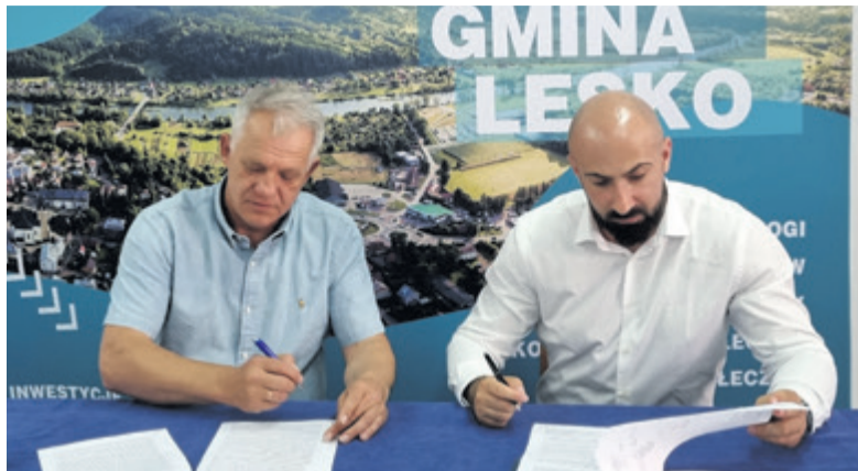
▲ Wykonawcą rewitalizacji wzgórza Baszta została firma BORSTAR. Planowany czas na realizację budowy to pół roku

Działka skomunikowana jest istniejącym zjazdem z drogą krajową, od którego biegnąć będzie ciąg pieszo – jezdny